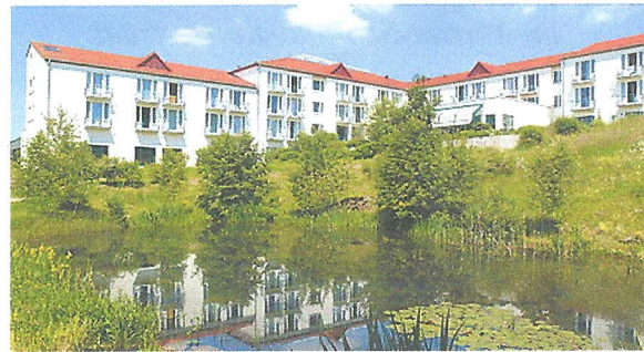
Reha-Klinik Bad Münster

Kontaktaufnahme über unsere Geschäftsstelle montags von 10 - 12 Uhr